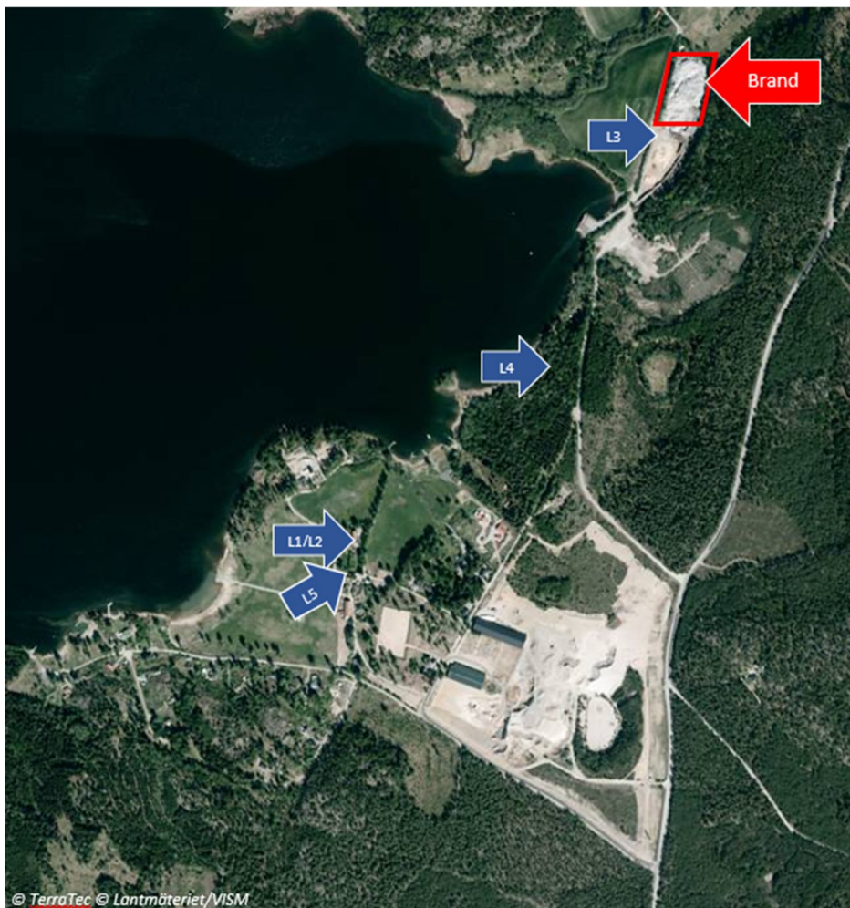
Figur 1 - Kartbild som påvisar mätpunkternas ungefärliga geografiska position.