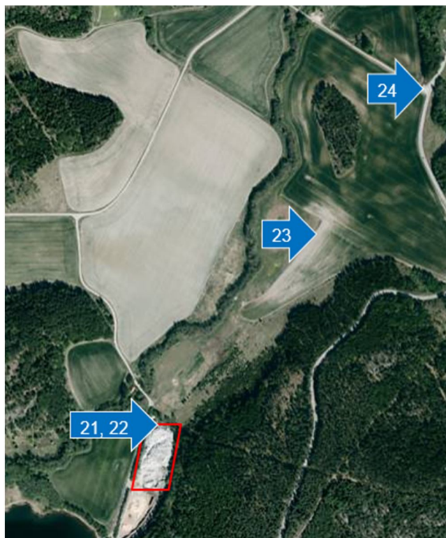
Figur 2 - Kartbild som påvisar mätpunkternas ungefärliga geografiska position.